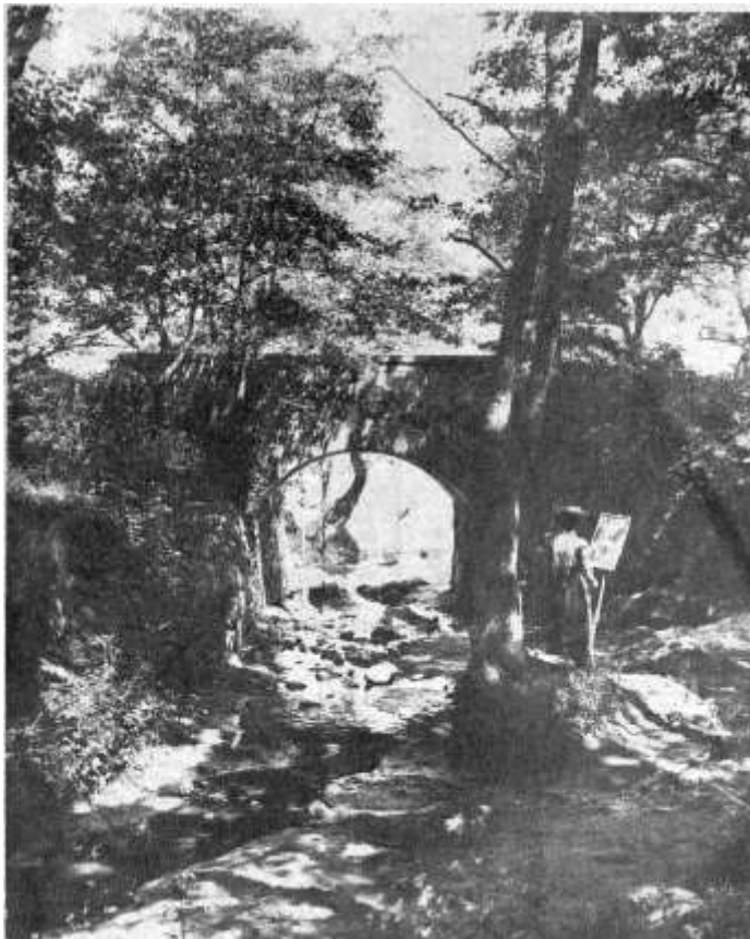
Frühling im Lachsachtal bei Neukuhren Freundlich klingt das Gemurmel des Baches, der über Steine und Geriesel rinnt. Licht und Schatten wirft die Sonne durch das junge Baumgrün hindurch. Die Zeit unseres Bildes entspricht seinem verträumten Zauber mehr als die unsere; noch vor dem ersten Weltkrieg wurde es aufgenommen. Im langen Rock und großen Hut steht die Malerin am Bach und mischt die Farben der frühlingsdurchlichteten Schlucht nach.

Nun legten auch Bäume und Sträucher ihr Frühlingskleid an. Besonders der herrlichste Baum, den es in unseren Breiten gibt, die Birke, die in unserem Nordosten so zahlreich vertreten war, stand plötzlich vor uns zart geschmückt wie eine Braut. Es gab Straßen, an deren Anblick man sich jetzt nicht sattsehen konnte, weil sie zu beiden Seiten von alten Hängebirken eingefasst waren. Zuletzt bekleideten sich die Eschen mit Grün. Dieser altgermanische Baum hatte wohl die längsten und nicht immer besten Erfahrungen im Laufe von Jahrtausenden gesammelt.